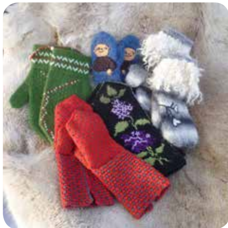
Text & bild: Maud Ån Bilder sid 11: Eva Öhrling

Det var 36 par vackra och välgjorda vantar från hela länet, med många olika mönster och tekniker i yllegran som lämnades in till 2014 års vanttävling.