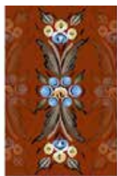
HANTVERKSVECKAN I ÖVERKALIX

Kurser i fin miljö och kulturaktiviteter under hela veckan