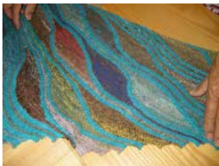
”Swing-stickning”- en spännande teknik

Deltagarna kommer mestadels från Norge, Danmark, Finland och Sverige, men en liten grupp kommer troget från Japan varje år. Några kommer även från England, USA och Korea. Evenemanget startar alltid på söndag