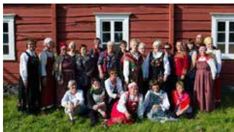
Deltagare i projektmöte

Projektet är ett samarbete mellan Midt – Troms Museum i Norge, Archangelsk Regionale Lore Museum i Ryssland och Åttio Svenskt Fjäll- och Samemuseum i Jokkmokk. Sámi Duodji – Sameslöjdstiftelsen och läns-hemslöjds-konsulenterna i Norrbotten är associerade i projektet med ansvar för kontakter och medverkan av slöjdare/hantverkare från Norrbotten.