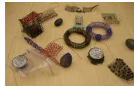
Här har det stickats i metall

det inspirerande utbyten. Många av deltagarna är proffs i stickning genom design, garnförsäljning och utbildning, så det är verkligen inget vanligt kafferep, även om kvällarna tillbringas i olika hörn av lokalerna tillsammans. Veckan är alltid intensiv och personligen hade jag stor utdelning med inspiration och nya kunskaper, vilket jag tror att även de andra 4 deltagarna från Norrbotten fick.