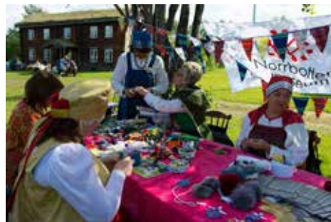
Kunskapsutbyte mellan slöjdare

De svenska deltagarna representerade en bred bild av olika verksamheter i Norrbotten där slöjd och hantverk ingår som metod, intresse, skapande verksamheter för alla åldrar och slöjd/duodji till försäljning: Sámi Duodji/Sameslöjdstiftelsen, Barn- och ungdomsslöjd, Norrbottens museum, Norrbottens läns Hemslöjdsförening, Textilservice Arbetsmarknadsavdelningen Luleå kommun, Lovikka Husmodersförening - varumärket "Äkta Lovikkavante", Vantfestival Lovikka/Junosuando, 11-ans Hantverkcenter i Junosuando,