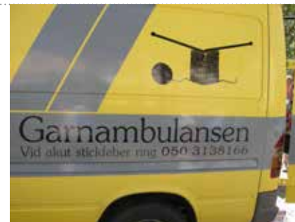
Räddaren i nöden

Vi fortsatte även till Malax och Korsnäs hembygdsmuseer, där vi riktigt fick beundra alla vackra Korsnäströjor och en demonstration av hur tre kvinnor hjälps åt att sticka en Korsnäströja samtidigt. Där fanns en fin utställning med fantastiska gamla mönster. I Malax hade vi tillfälle att se en fin utställning om tvåändsstickning. Ja, det var otroligt vad kvinnor har skapat med sina händer genom åren. Dagen avrundades med en härlig middag på en restaurang i skärgården med havsutsikt.