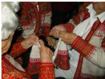
Tre kvinnor stickar en Korsnäströja

skyar med buss till Stundars fina hembygdsmuseum utanför Vasa. Det påminner mycket om Skansen med gamla fina byggnader och rikligt med allogeföremål i trä och textil. Vissa dagar, framför allt under sommaren, är man extra aktiva med förevisning av gamla hantverkstekniker. Tyvärr hindrade ett ihållande regn oss att utforska de fina trädgårdarna som fanns i anslutning till hembygdsmuseet.