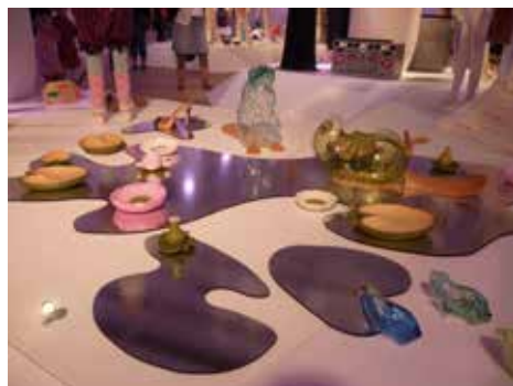
Näckrosor, bävvar och andra djur

visar slöjdens nya nivåer! Målgruppen är unga vuxna.