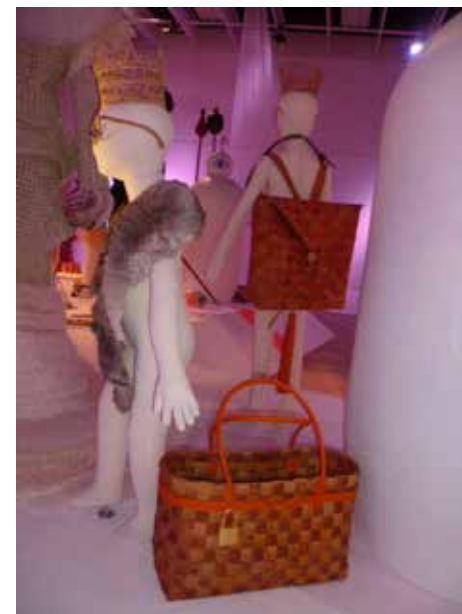
Näver och rotslöjd