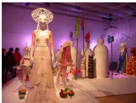
Procession av mystiska väsen

Next Level Craft kommer att visas som vandringsutställning under 2015/2016 i Östersund Jämtland i Härnösand Västernorrland och i Luleå/Norrbottnen.